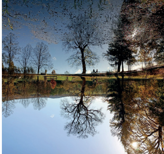
Fotó: Ferenczy Noémi

Az első feladatom, amit meg kell tennem: felismerni életemben a szavaim kínálta teremtő erő nagyságát. A kimondott szó teremtő ereje ez! Elhagyja szájamat és önálló életet él. Sohasem szabad elfelednem, ahogyan odafigyelek mások szavaira, ugyanúgy mások is figyelnek szavaimra. Mindannyian