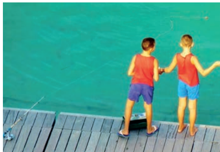
Otranto tengerpartján

„Én a fülemet adtam neked, de te hallottál valamit rólam, és mi nem be-