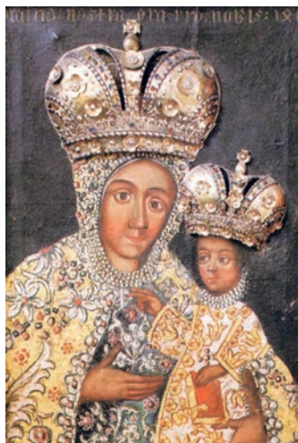
A czestochowai kegykép