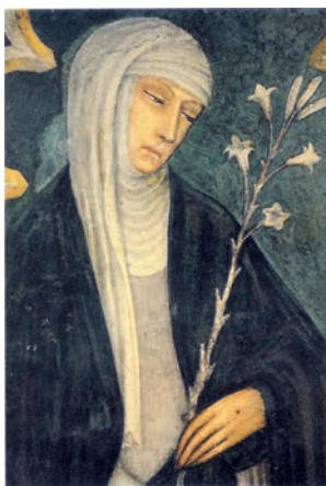
Andrea Vanni freskója a 14. századból

Közbenjárása eredményeként XI. Ger-gely pápa 1377. január 17-én visszatért Rómába. Ezzel lezárult egy 70 éves kor-szak. Katalin közben folyamatosan bé-kít, járja a városokat. Pestis idején gyó-