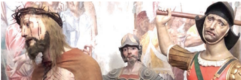
Sacro Monte di Varallo