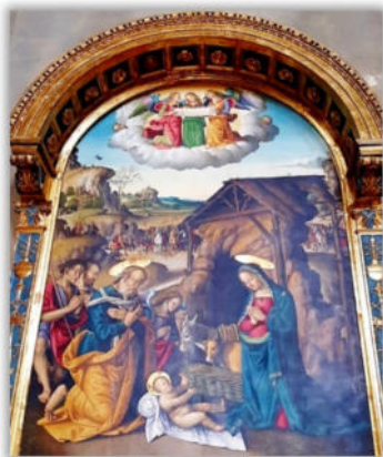
Fotó: Gubbio, Szent-Agoston templom festménye

Érték és rend. Mit ér az első, ha nincs mögötte az utóbbi, csak pusztán megfelelési vágy? Mit ér a rend, ha elvesztette értékét az igazi eszme, az igazi szó, az áthallás, ha hamis kincsekért odadobjuk saját üdvösségünket? Nem kétséges, persze, nyilván mindannyiunkat szereteténység hajszol, miközben az ünnep előtti lázas készülődésben csakis azzal vagyunk elfoglalva, hogy kitaláljuk, mi lehet a legütősebb meglepetés hozzátartozóink számára. Értéktrendjeink torzulnak, egyvalami azonban marad.